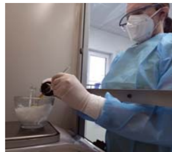
Steinkohlenteerspirit Er wird zum Schluss in kleinen Portionen und unter häufigem Abschaben der Salicylsäure-Suspension zugesetzt.