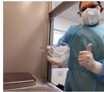
Inprozesskontrolle In die Salicylsäureverreibung wird die vorgeschriebene Menge an Grundlage schrittweise eingearbeitet.